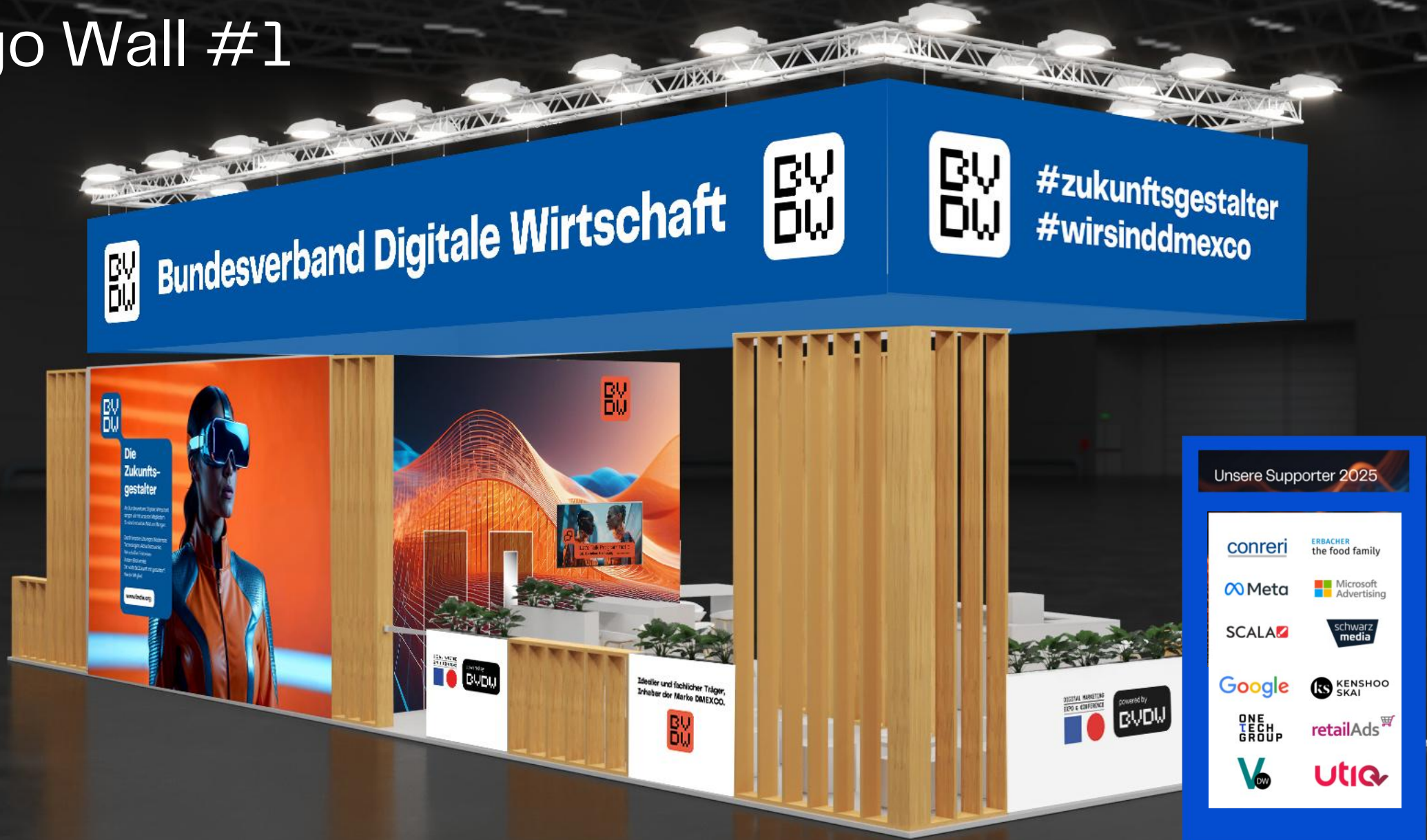
Beispielhafte Darstellung bei einem Großevent