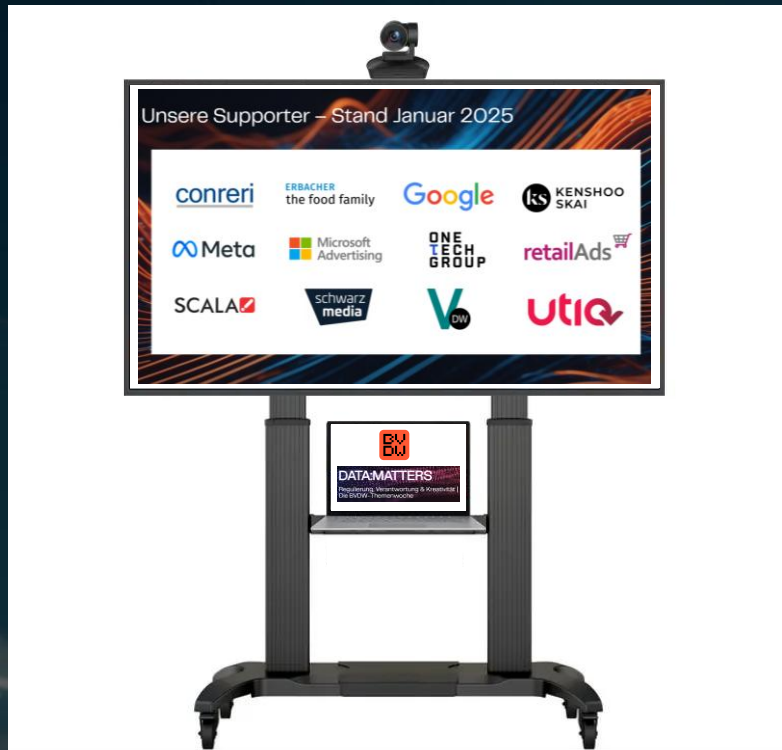
Beispielhafte Darstellung einer digitalen Logo Wall (auf einem Event)